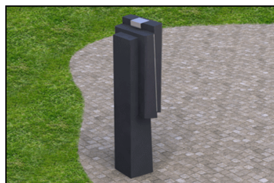
Con pie soporte