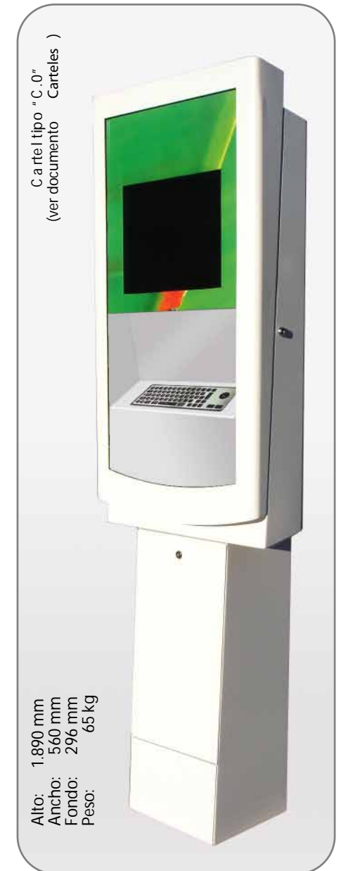
Pie soporte opcional