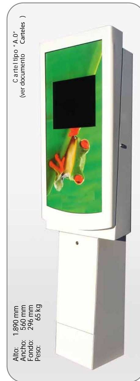
Pie soporte opcional