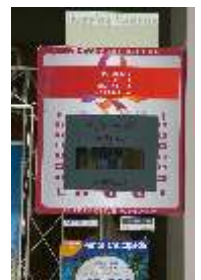
Centro H. Valencia